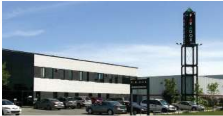
Montreal, Canada Manufacturing Center & R&D