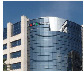
Europe Paradox Europe & R&D