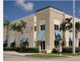
Miami, Florida, US Paradox USA