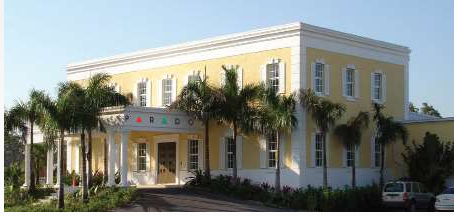
Bahamas Headquarters & International Sales Office